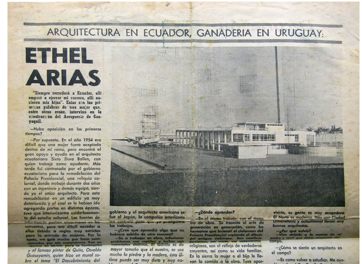
Figura 3: Imagen del proyecto para el Aeropuerto de Guayaquil S.A. (1977). Arquitectura en Ecuador. Ganadería en Uruguay: Ethel Arias. La Mañana .

Al poco tiempo de regresar a su país natal con su pareja e hijas, la relación sufre una ruptura y León regresa a Ecuador. Tras varias décadas dedicadas a la ganadería, Ethel Arias fallece a los 90 años el 3 de julio de 2015, en Montevideo.