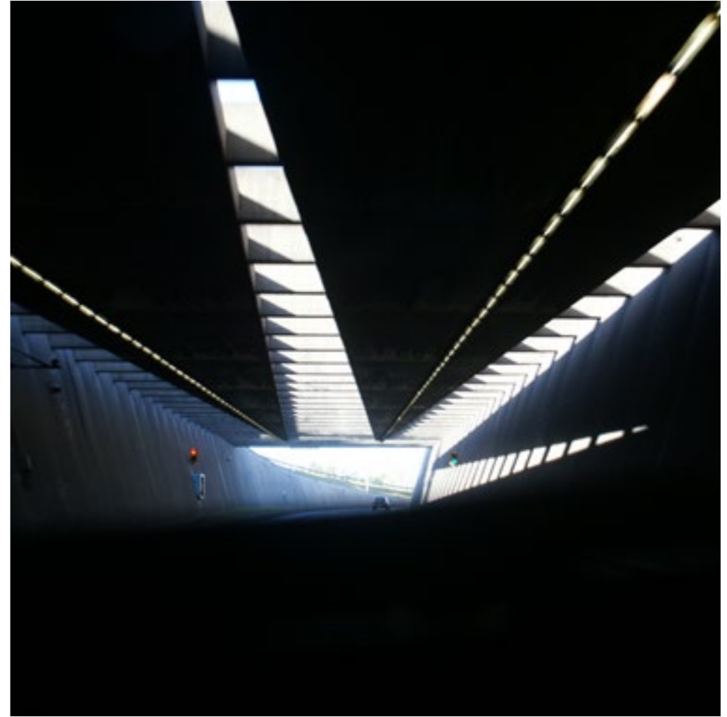
Figura 9: Rampa de acceso del lado Paraná.