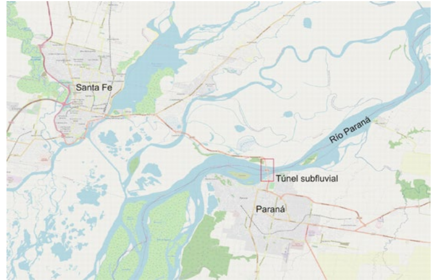
Figura 2: La provincia de Santa Fe y la región mesopotámica en Argentina.

En tal sentido, dadas las características de este contexto político, resulta un tanto paradójico que el Ejecutivo nacional no acompañara la iniciativa de los Estados provinciales y ello influyó en la decisión final —por parte de los gobernadores— de utilizar el lecho del río, de jurisdicción provincial, y no la superficie, de jurisdicción nacional, para