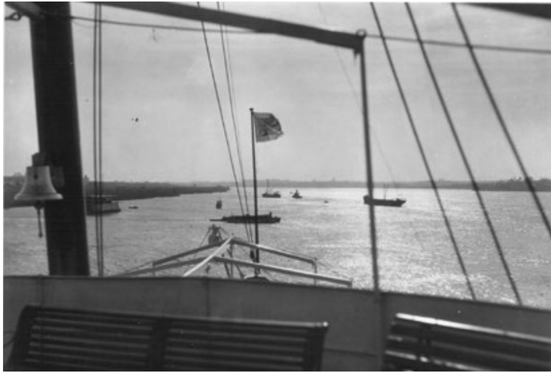
Figura 2: Recorrido de la balsa hacia el río Paraná.

implantar la nueva infraestructura en lugar de un puente, que hubiera sido la solución más convencional.