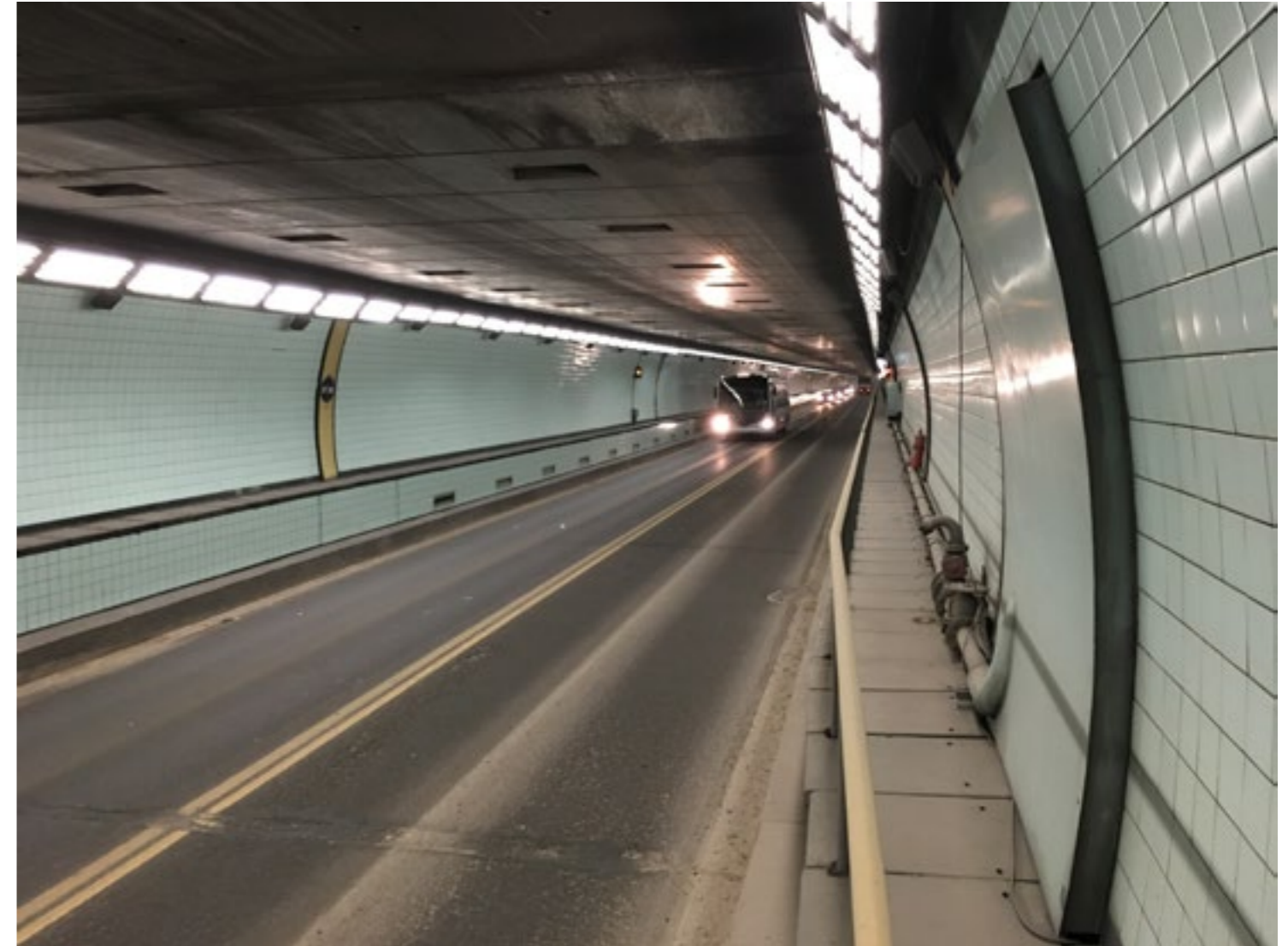
Figura 6: Interior del túnel subfluvial.