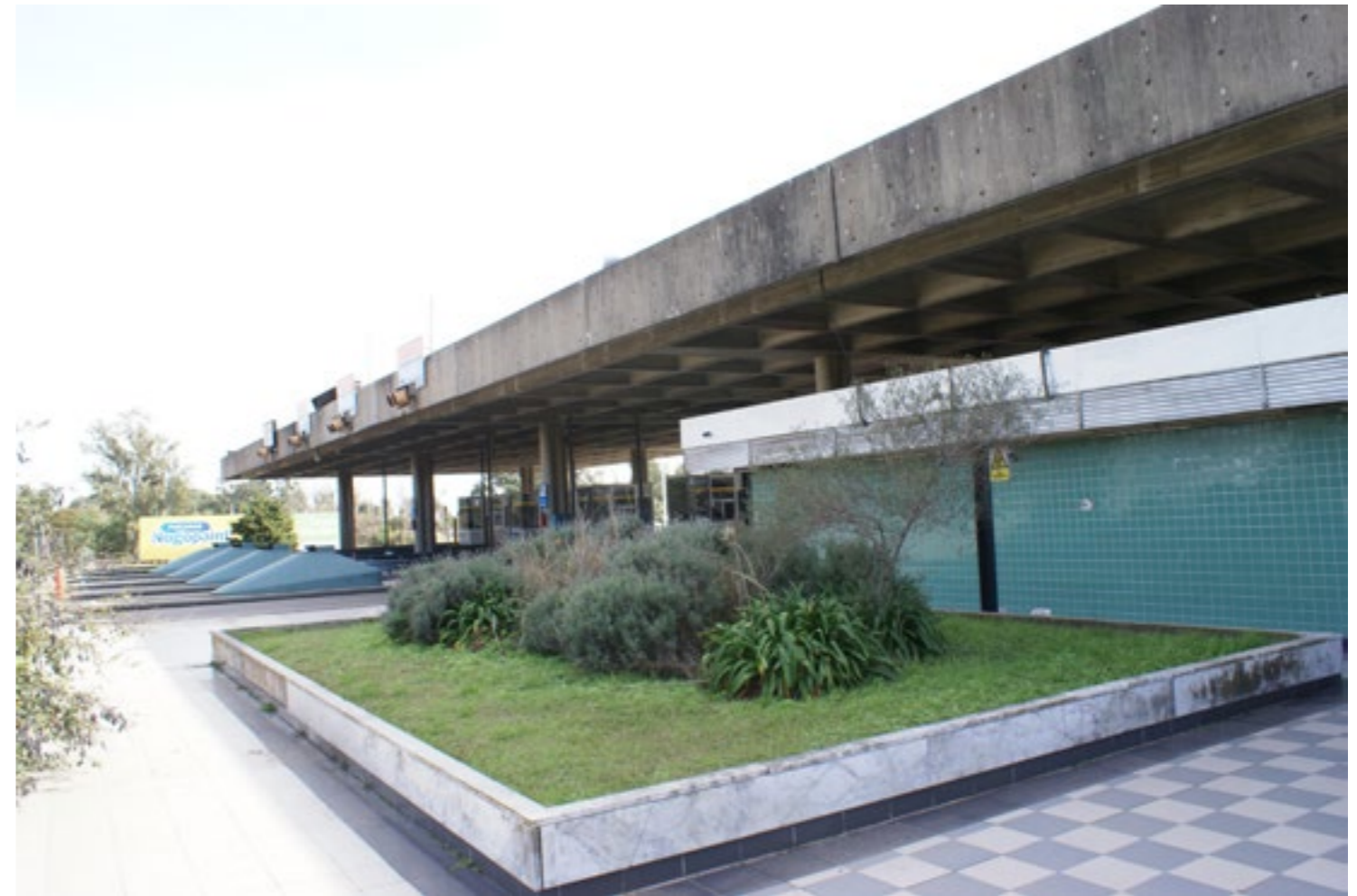
Figura 7: Cubierta de las zonas de peaje y oficinas en el lado Santa Fe.

“siendo la finalidad de este edificio extraer e inyectar aire al túnel, las chimeneas a través de las cuales esta función se realiza son los elementos principales de la composición arquitectónica. Teniendo en cuenta que la toma de aire es, por razones funcionales, el elemento de mayor altura, su percepción a gran distancia la convierte en el elemento símbolo distinguible de las obras del túnel”. (Álvarez, M. R., 1965) (Figura 10)