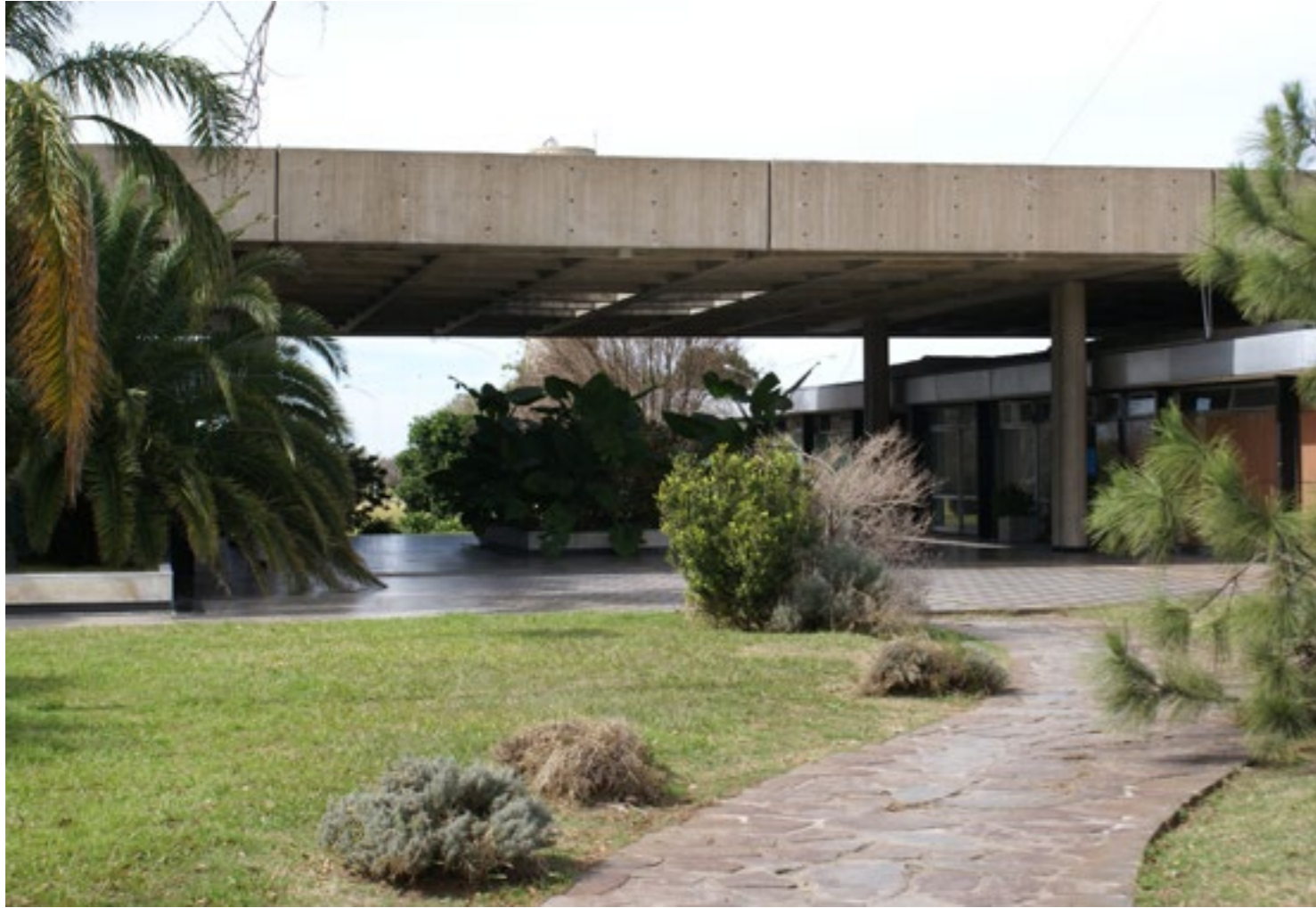
Figura 8: Sector de oficinas administrativas en el lado Santa Fe..