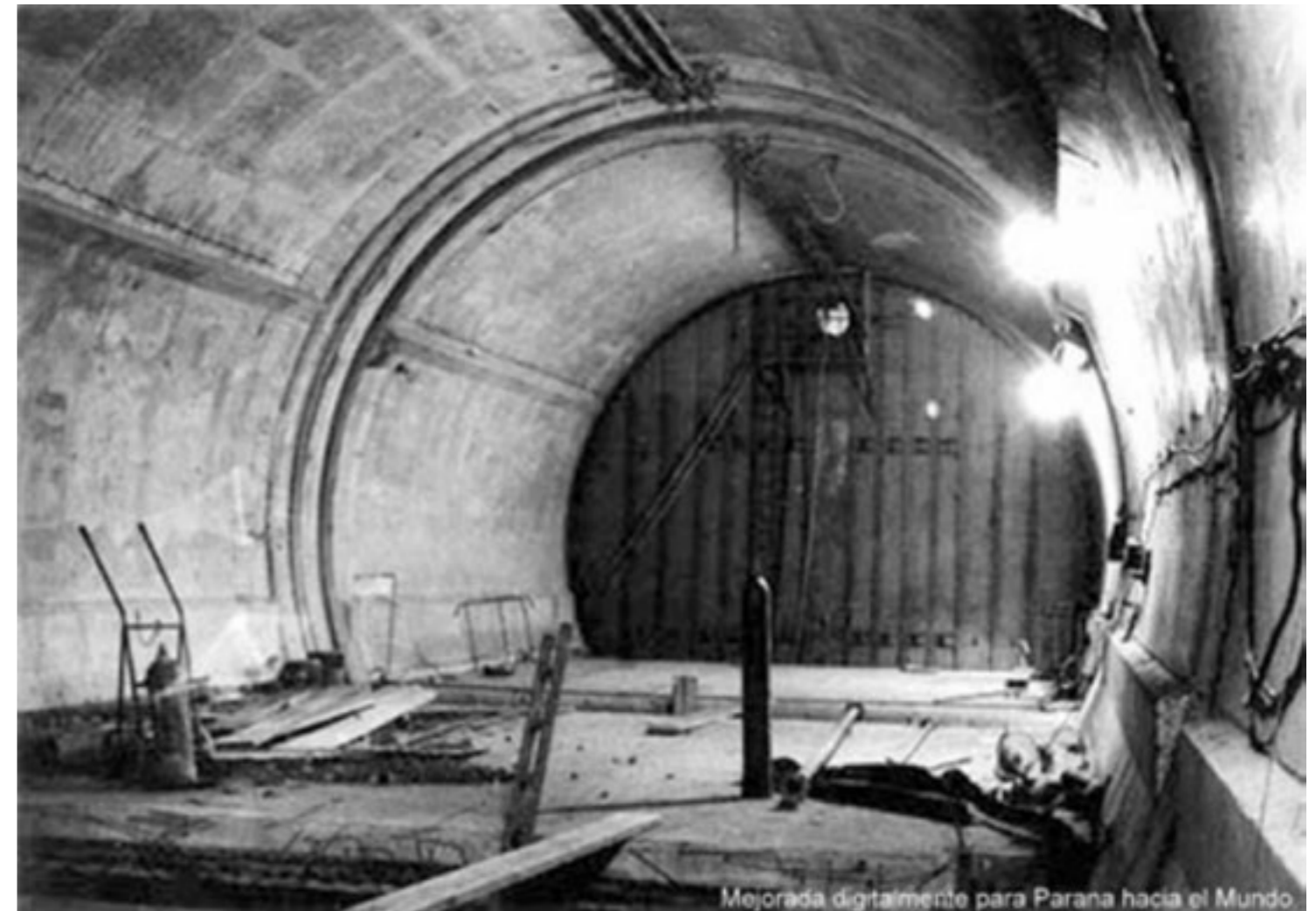
Figura 5: Trabajos en el interior de los tubos.

La gran cantidad de trabajo realizado y la coherencia en el modo de proyectar (una lógica funcional estricta, soluciones técnicas ajustadas y expresión formal moderna) le habían colocado en una posición de reconocimiento tanto de sus clientes como de los colegas, que destacaban tanto la calidad de su arquitectura como la atención puesta en la ejecución. Según lo define Jorge Mele, "insistir en la calidad de los espacios, en las proporciones apropiadas según