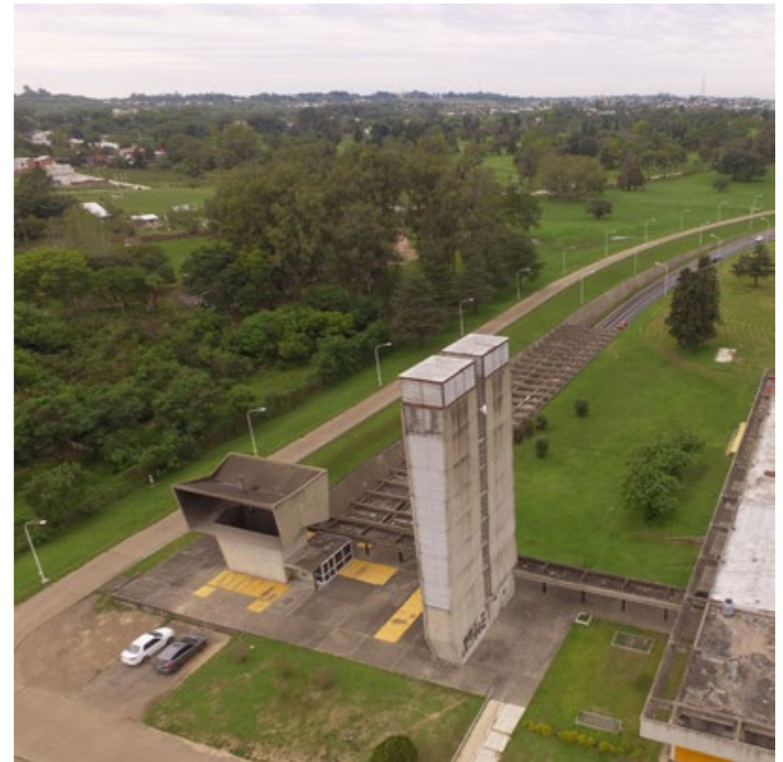
Figura 10: Torres de ventilación en el lado Paraná (extracción de aire viciado e inyección de aire limpio).

El túnel subfluvial, factor determinante del proceso de modernización y dinamización económica de una amplia región, desde un punto de vista profesional, resulta una obra que demuestra una potente integración entre la arquitectura y la ingeniería, que involucró a profesionales argentinos y extranjeros generando un know how hasta entonces inexistente. La dimensión técnica que se hace presente en la ejecución del túnel es reveladora de la