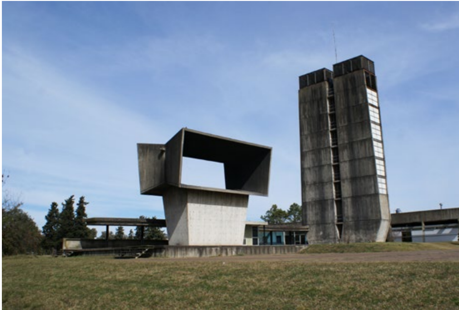
Figura 11: Torres de ventilación en el lado Paraná.