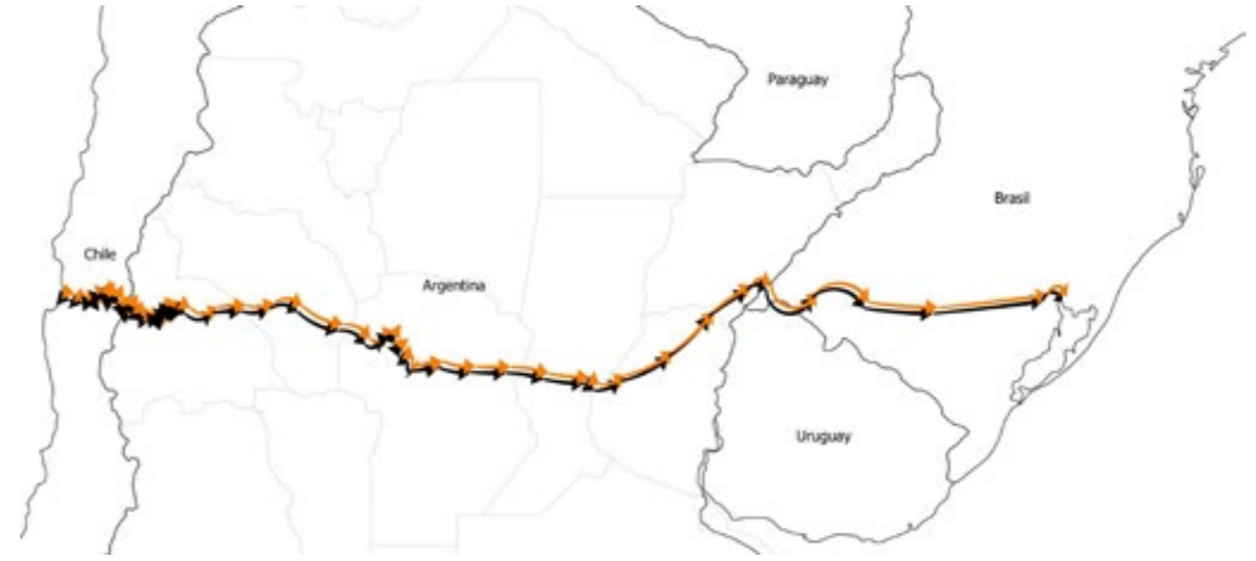
Figura 12: Ruta principal que constituye el corredor bioceánico terrestre que une los océanos Atlántico y Pacífico, para el que el túnel subfluvial resultó ser un elemento fundamental

capacidad instalada en el país para procesar la magnitud de información requerida y la pericia para materializarla, así como el proyecto arquitectónico se manifiesta como una intervención en el paisaje, que, con pocos, pero contundentes gestos, expresa la voluntad humana de dominar la naturaleza. La obra, incluso, sobrellevó satisfactoriamente la creciente extraordinaria de 1983. La misma determinó la colocación de una manta geotextil protectora para evitar la flotación de los tubos y fue finalizada en la década de 1990. Pero aun con la erosión del lecho del río el túnel no sufrió daños. Y si bien el trayecto Paraná-Santa Fe fue clausurado durante los meses de crecida, en sus 50 años el túnel sólo dejó funcionar por 24 horas en julio de 1983 (Kuchen, 2005).