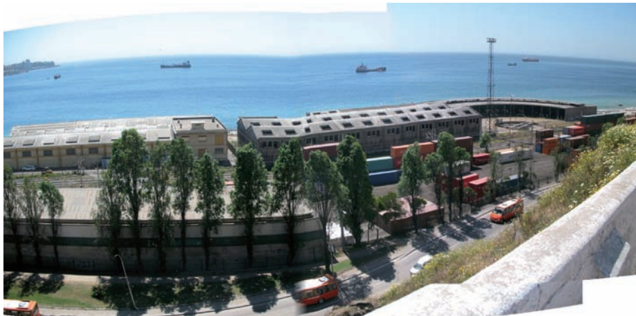
Antigua Maestranza, Valparaíso

conformando en ocasiones en la zona norte un conjunto de viviendas continuas, como en el caso del puerto de Iquique.