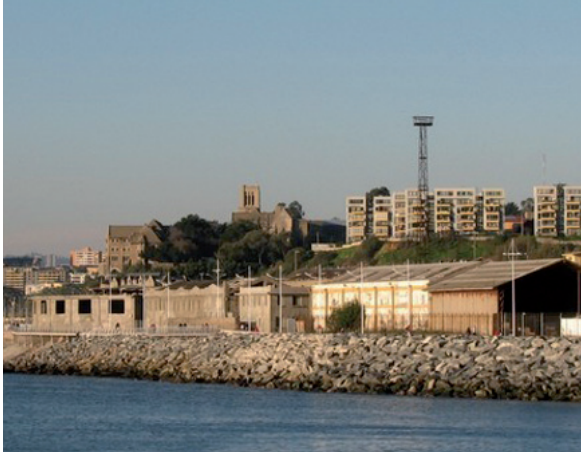
Bodegas Portuarias, Valparaíso