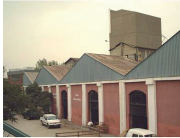
Antigua Maestranza de Tranvías de Santiago

Hacia fines del siglo dieciocho, etapa que podemos definir como preindustrial, la economía se caracterizaba por el dominio de una actividad manufacturera dispersa, de carácter rural, generalmente de pequeño tamaño, desarrollada artesanalmente en talleres familiares.