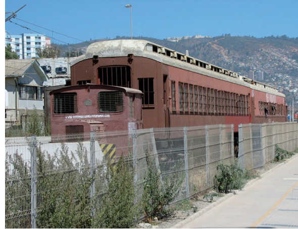
Vestigios ferroviarios, Valparaíso