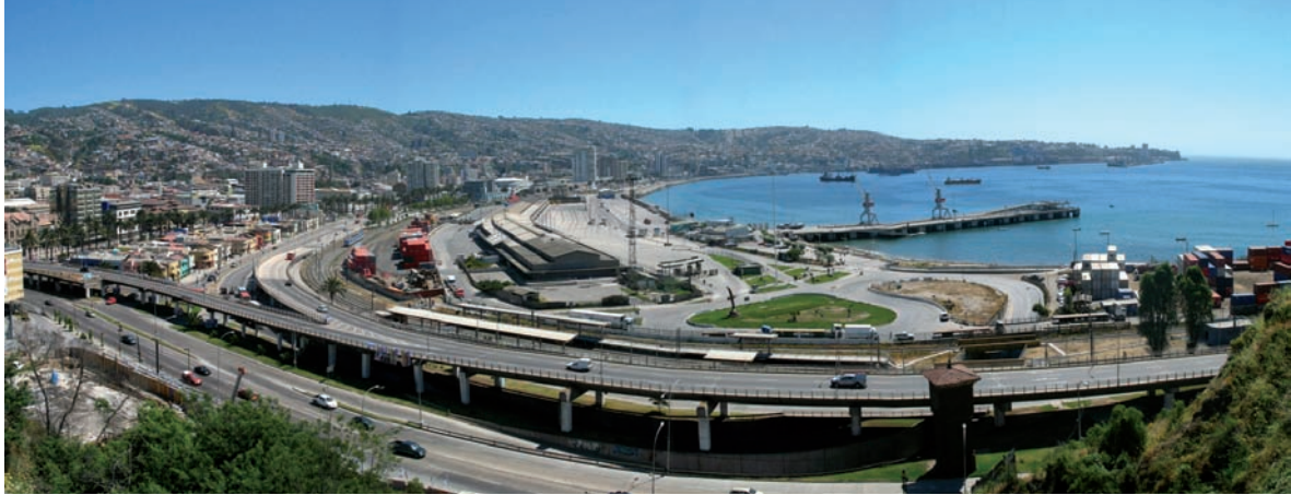
Bodegas Simón Bolívar, Valparaíso

aletargadas caletas y fondeaderos que jalonaban el litoral alcanzaron en pocos decenios la condición de ciudades.