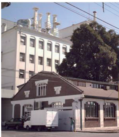
Molino San Cristóbal