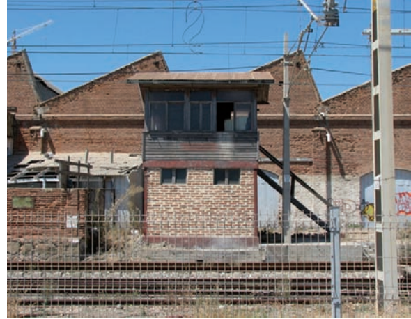
Industrias y ferrocarriles, Valparaíso

A modo de ejemplo, la visión más generalizada que se tiene de la arquitectura de las ciudades portuarias es la de un conjunto de viviendas pintorescas que se superponen unas a otras, dominando el espacio marítimo en el que se concentra el movimiento de navíos en una suerte de anfiteatro que contiene a la planta edificada.