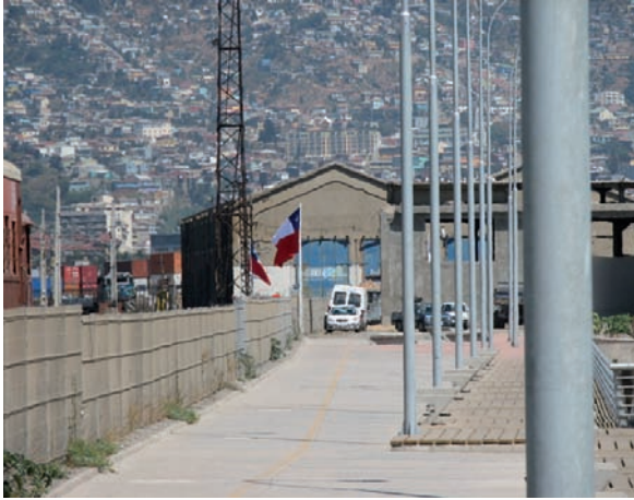
Bodegas industriales, Valparaíso