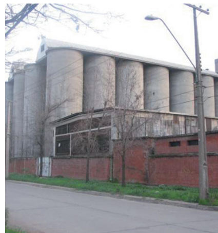
Ex Empresa de Comercio Agrícola (demolida)

hecho que le permitía cumplir escasamente con las necesidades mínimas de subsistencia sin generar excedentes. Durante dicho período, la población total de Chile no alcanzaba a los cuatrocientos mil habitantes presentando una actividad económica que se concentraba mayoritariamente en la zona central del país.