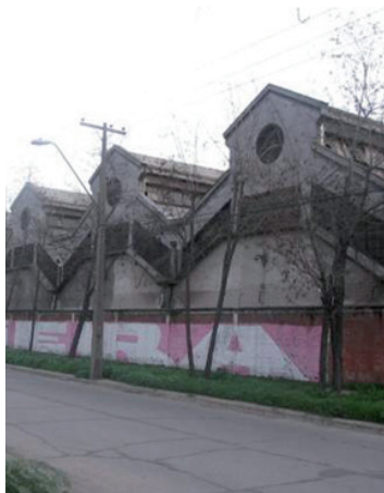
Ex Bodegas y Silos, Empresa de Comercio Agrícola (demolida), ejemplo de Patrimonio Industrial