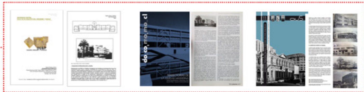
Figura 11. Representación que grafica uso y replicación de las primera publicaciones en diversas fuentes bibliográficas que abordan temáticas en torno la arquitectura moderna, historia y procesos urbanos en las ciudades puerto o vivienda colectiva.