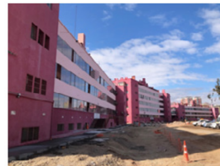
Figura 1. Edificios Colectivos de la Caja del Seguro Obrero Social. Fotografías actuales. Arriba de izquierda a derecha. Colectivos de Arica y colectivos de Iquique. Abajo de izquierda a derecha. Colectivos de Tocopilla y colectivos de Antofagasta.