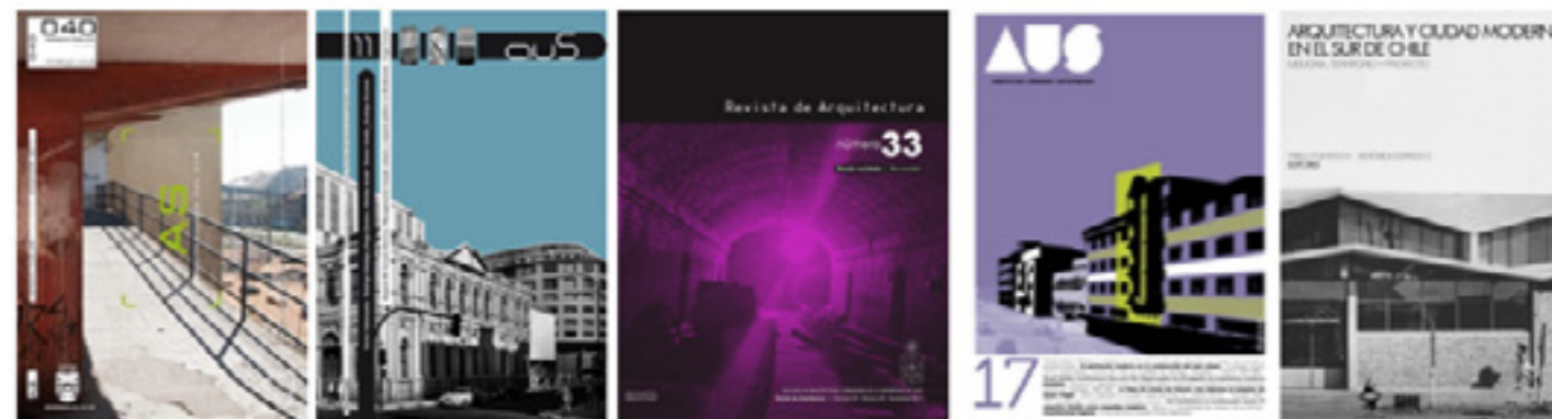
Figura 7. Publicaciones en general. De izquierda a derecha: Revista Arquitecturas del Sur N° 40 (2011), Revista AUS N° 11 (2011), Revista de Arquitectura N° 33 (2017), Revista AUS N° 17 (2017), Arquitectura y ciudad moderna en el sur de Chile : Memoria, territorio y proyecto (2018)

A este respecto, en el artículo titulado Laboratorio confinado: arquitectura moderna en el norte de Chile señala que estos edificios se constituyen como “una iniciativa sin precedentes en el aspecto social para cuatro ciudades del norte” (Galeno 2008, p.19), por parte de la Caja del Seguro Obrero, además de representar la ideología de la habitación colectiva que tenía su administrador, junto con consolidar “una arquitectura socialista que coincide más con los ideales de las vanguardias rusas que con las obras que realizaba la Caja de Habitación Barata” (Galeno. 2008, p. 19), como también convertirse en un paradigma de la vida moderna, al tener como