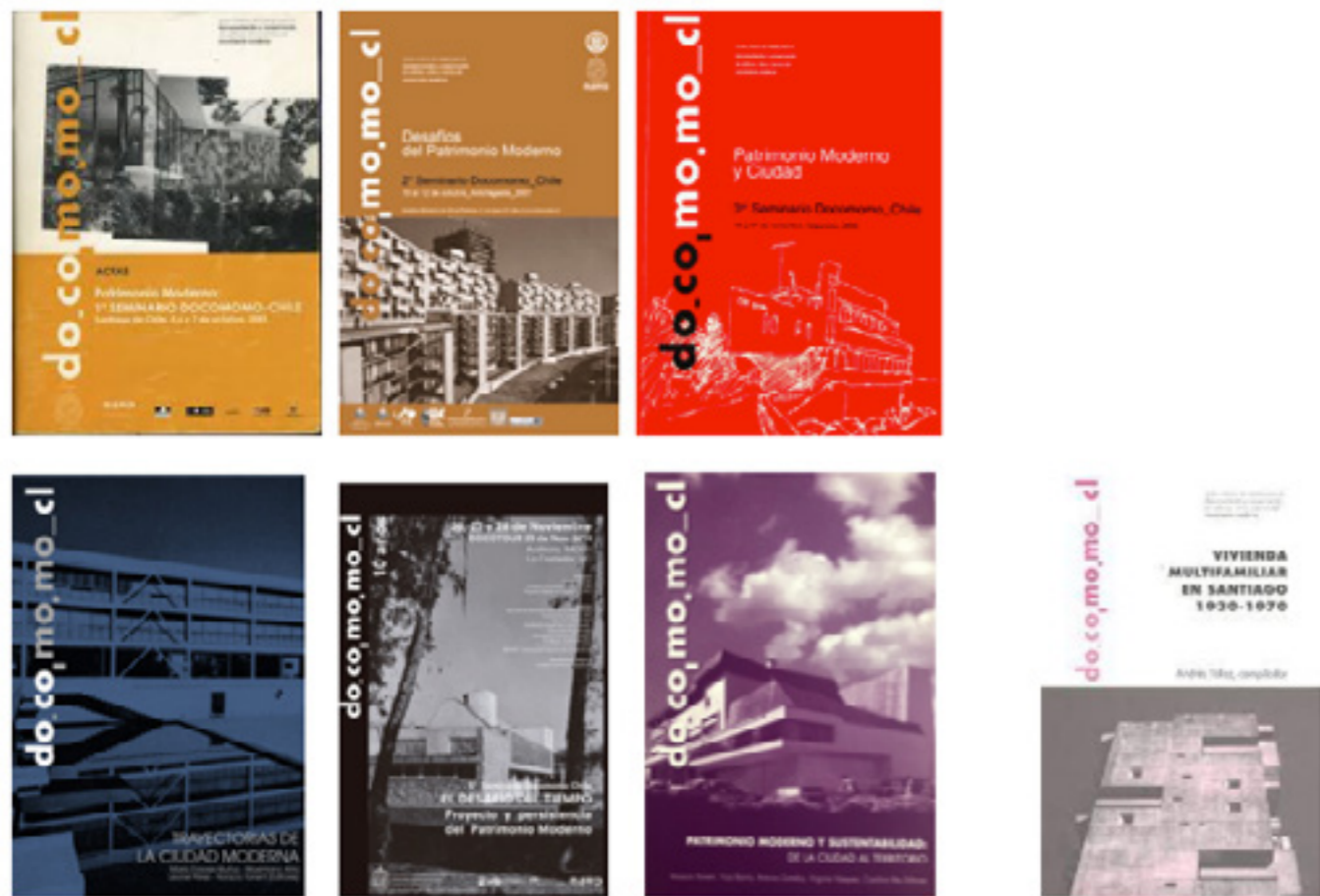
Figura 5. Valorización e importancia del Proyecto Moderno. Libros de Actas. Seminarios Docomomo-Chile. Arriba de izquierda a derecha: I Seminario: Patrimonio moderno (2005), II Seminario: Desafíos del patrimonio moderno (2007), Seminario, III: Patrimonio moderno y ciudad (2009). Abajo de izquierda a derecha: IV Seminario: Trayectorias de la ciudad moderna (2012), V Seminario: El desafío del tiempo. Proyecto y persistencia del patrimonio moderno (2014), VI Seminario: Patrimonio moderno y sustentabilidad (2018), Vivienda Multifamiliar en Santiago 1930-1970. Habitación Moderna: Técnica y proyecto (2009).