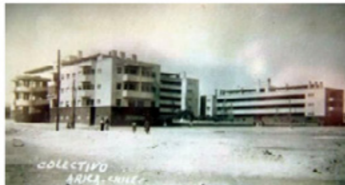
Figura 10. Arriba de izquierda a derecha: Isométrica Colectivos Obreros. Edificios Colectivo de Iquique. Abajo de izquierda a derecha: Edificios Colectivos de Tocopilla. Edificios Colectivos de Arica. Fuente: Fotos Iquiqueñas, Arica Recuerdos de Siempre, Tocopilla y su Historia. Elaboración del autor.