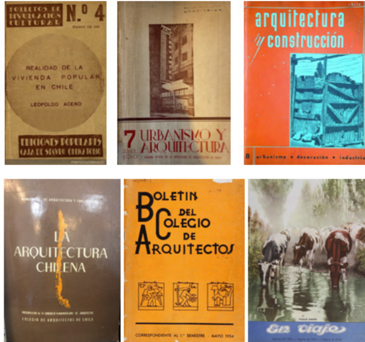
Figura 3. Las primeras publicaciones. Arriba de izquierda a derecha: Folleto de Divulgación Popular N.º 4 de la Caja del Seguro (1940), Urbanismo y Arquitectura N.º 7 (1940), Arquitectura y Construcción N.º 8 (1947). Abajo de izquierda a derecha: Arquitectura y Construcción N.º 11 (1947), Boletín de Arquitectura N.º 26 (1954), Revista en Viaje N.º 250 (1954).