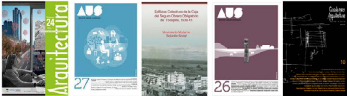
Figura 9. Publicaciones específicas. De izquierda a derecha. Arica - Iquique: Revista de Arquitectura N° 24, Revista AUS N° 27 (2020). Tocopilla: Edificios colectivos de la Caja del Seguro Obrero Obligatorio de Tocopilla, 1939-41 : Movimiento moderno, solución social (2011), Revista AUS N° 26 (2019). Antofagasta: Cuadernos de Arquitectura N° 10 (2017).