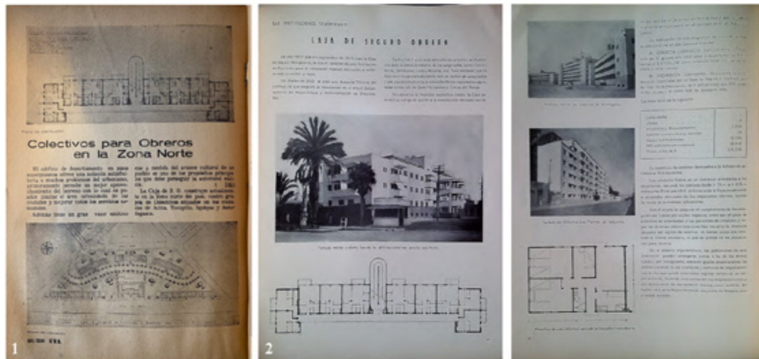
Figura 1. Edificios Colectivos de la Caja del Seguro Obrero Social. Fotografías actuales. Arriba de izquierda a derecha. Colectivos de Arica y colectivos de Iquique. Abajo de izquierda a derecha. Colectivos de Tocopilla y colectivos de Antofagasta.

central para conformar jardines o “hacer una gran piscina reglamentaria”, en donde, “los amplios balcones corridos de los pabellones servirán en este caso como las más bellas tribunas para el público que quiera presenciar el espectáculo de un campeonato de natación” (1940, p. 69)