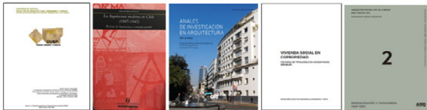
Figura 6. Publicaciones de carácter compilatorio y general. La Trayectoria Espacial de la Corporación de la Vivienda (CORVI) (2009), La Arquitectura moderna en Chile. (1907-1942). Revistas de Arquitectura y estrategia gremial (2012), La arquitectura moderna en la producción de la gran ciudad : Chile 1930-1970. Anales de Investigación en Arquitectura Vol. 3. (2013). Vivienda social en copropiedad. Memoria de Tipologías en Condominios Sociales (2014). Arquitectura en el Chile del siglo XX. Volumen 2 (2016).