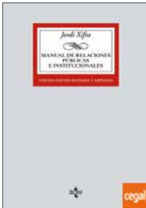
Xifra, J. (2017). Manual de Relaciones Públicas e Institucionales. Tercera edición revisada y ampliada . Madrid: Tecnos.