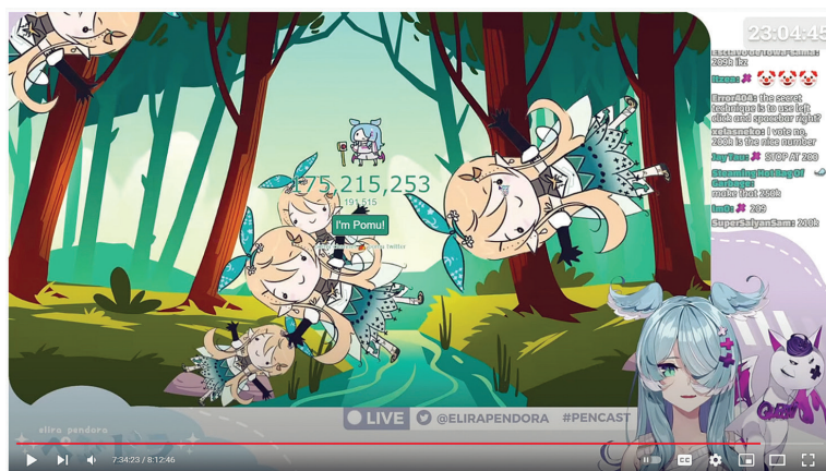
Imagem 4. Elira Pendora clica um botão 200 mil vezes durante uma live stream de 8 horas

#EliraPendora #Pencas #PencasART 【TM POMU】 I click the Pomu button 200K times 【NIJISANJI EN | Elira Pendora】 163,264 views · Streamed live on Nov 14, 2021