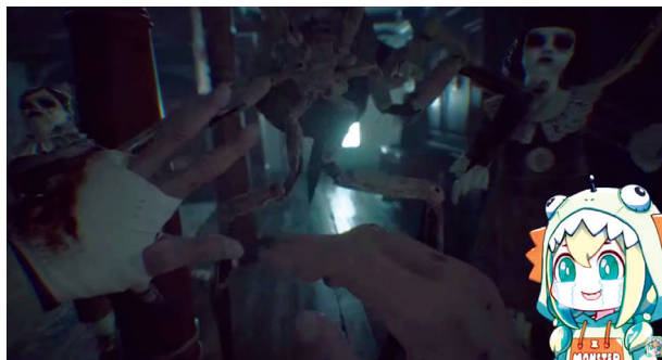
Imagem 1. Ao apertar um botão, Amano Pikamee pode fazer seu avatar chorar, demonstrando o medo que a streamer sente enquanto joga o jogo de terror Resident Evil Village