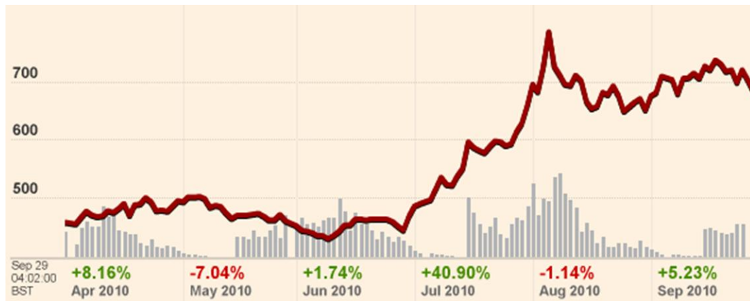
Evolución del Precio del Trigo en la Bolsa de Chicago (centavos de dólar por bushel)